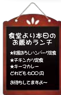
メッセージボード