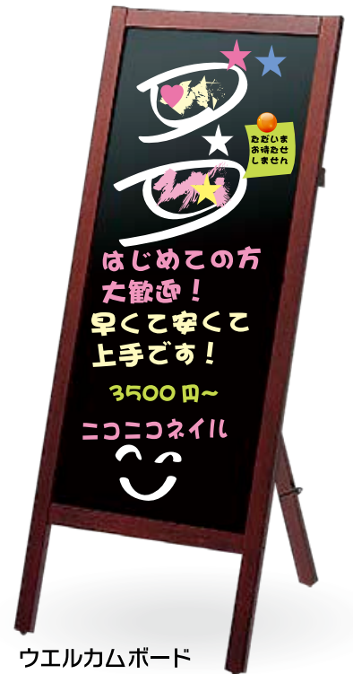
ウエルカムボード